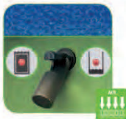
دارای شناور در هر دو مخزن آب تمیز و کثیف جهت اعلام پر یا خالی بودن مخزن که در مخزن آب کثیف با فعال شدن شناور موتور مکش قطع و از ورود آب به موتور جلوگیری می شود.