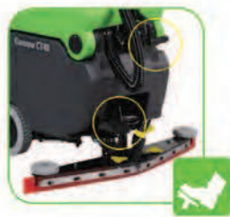
مجهز به پدال بالا و پایین برنده سینی برس و دستگیره تیغه مکش جهت جابجایی راحت دستگاه