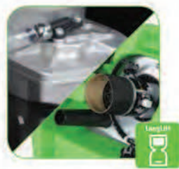
دارای موتورهای با طول عمر و راندمان کاری بالا که در دراز مدت سهم بسزایی در کاهش هزینه های تعمیراتی در پی خواهد داشت.