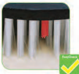
دارای نشانگر ارتفاع مجاز پرتز برس جهت اعلام زمان تعویض