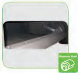
دارای فلپ میانی برس از جنس استیل