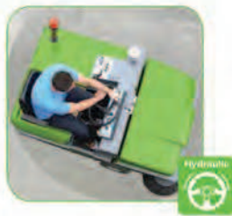
دارای فرمان هیدرولیک جهت افزایش قدرت مانور دستگاه