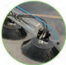
کیت مربوط به نصب برس جانبی سوم جهت نظافت مکانهای غیر قابل دسترس (Optional)