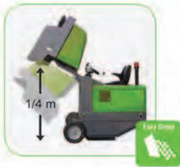
دارای قابلیت تخلیه زباله به صورت هیدرولیک تا ارتفاع ۱۴۰ سانتیمتر