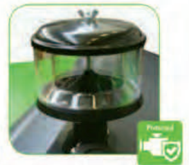
مجهز به فیلتر ساخت کمپانی دونالدسون آمریکا جهت فیلترینگ هوای ورودی موتور و جلوگیری از ورود گرد و غبار به داخل موتور