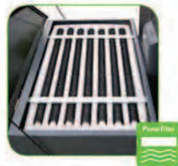
دارای فیلتر چنددار قابل شستشو از جنس پلی استر با سطح مقطع ۸ م ۲ جهت جذب کامل گرد و غبار