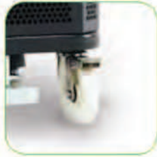
دارای چرخ های بزرگ و مجهز به قفل جهت افزایش ایستایی دستگاه