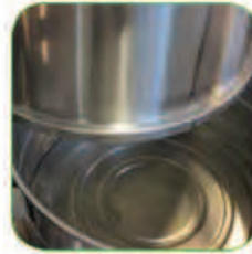
امکان جداسازی مخزن زباله از دستگاه جهت تخلیه آسان