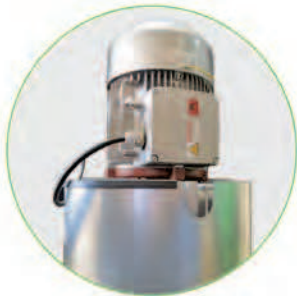
موتور ساخت SIEMENS آلمان