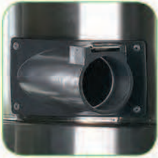
دارای دریچه ورودی لوله خرطومی از جنس فولاد