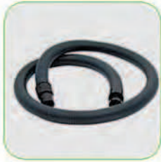
دارای قابلیت استفاده از لوله های خرطومی با متر از بالا (حداکثر تا ۲۰ متر)