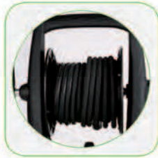
دارای قرقره شیلنگ جمع کن