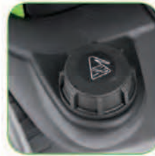
دارای مخزن مواد شوینده با ظرفیت ۷/۵ لیتر