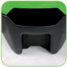
طراحی ضد ضربه کاور جلوی دستگاه