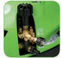
دارای پیچ تنظیم فشار آب خروجی متناسب با میزان آلودگی