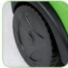
دارای چرخ های بزرگ جهت تسهیل در جابجایی دستگاه