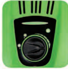
دارای پیچ تنظیم جهت کم و زیاد کردن میزان ریزش مواد شوینده