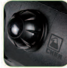
دارای مخزن مواد شوینده با ظرفیت ۲۵ لیتر