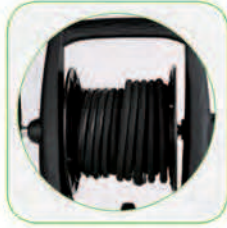
دارای قرقره شیلنگ جمع کن