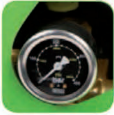
دارای نشانگر میزان فشار آب خروجی