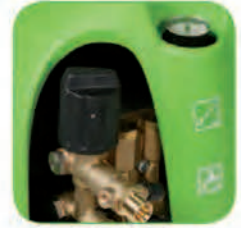
دارای پیچ تنظیم فشار آب خروجی، متناسب با میزان آلودگی