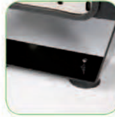
طراحی ضد لرزش شاسی