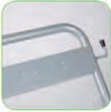
طراحی منحصر به فرد دسته جهت جابجایی آسان بروی هر گونه سطح