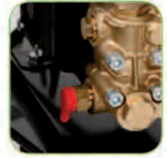
دارای پیچ تنظیم فشار آب خروجی، متناسب با میزان آلودگی