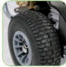
دارای چرخ های بزرگ جهت تسهیل در جابجایی دستگاه