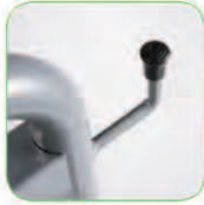
دارای نگهدارنده لاسه