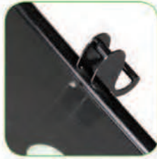
دارای دو نگهدارنده لانس