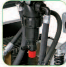
مجهز به فیلتر با حجم بالا جهت بالا بردن رانندگی