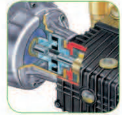
دارای کوپلینگ ضد لرزش که در دراز مدت سبب افزایش طول عمر قطعات می شود