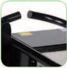
طراحی منحصر به فرد دسته جهت جایجایی آسان بروی هر گونه سطح