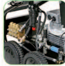
دارای محفظه بزرگ فیلترینگ آب جهت افزایش کارایی دستگاه