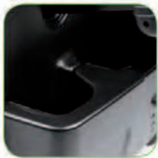
طراحی ضد ضربه کاور جلوی دستگاه