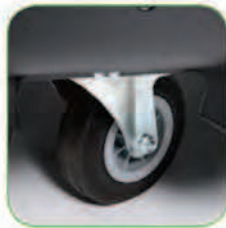
دارای چرخ های بزرگ جهت تسهیل در جابجایی دستگاه