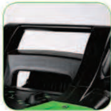
طراحی منحصر به فرد دسته جهت جابجایی آسان بروی هر گونه سطح