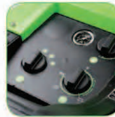
دارای صفحه فرمان ساده با قابلیت تنظیم دمای آب خروجی