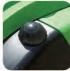
دارای مخزن مواد شوینده با ظرفیت ۲۰ لیتر