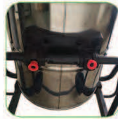
مجهز به سیستم تخلیه مخزن به روش دورانی حول محور بدنه جهت تخلیه آسان