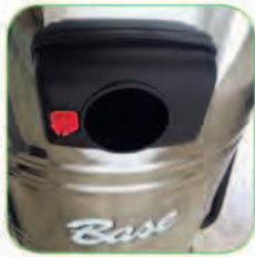
دارای قفل نگهدارنده لوله خرطومی جهت جلوگیری از اتلاف جریان مکش