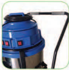
طراحی منحصر به فرد دسته دستگاه جهت جابجایی آسان