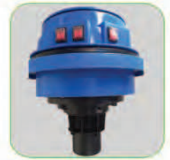
دارای شاور کنترل کننده سطح مایعات جهت جلوگیری از ورود مایعات به موتور